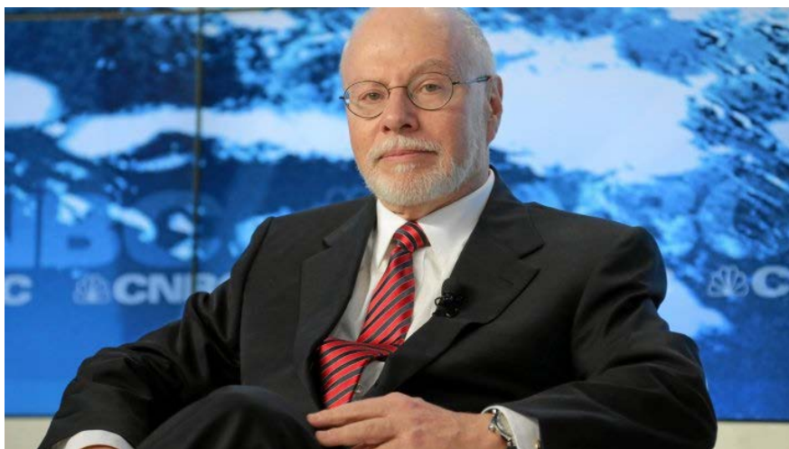
Le financier Paul Singer, à la tête d'Elliott Management, lors du forum de Davos en 2013

C'est ce qui s'est passé avec l'Argentine à qui Elliott Management a racheté, à travers NML et Aurelius, des bons du trésor entre 2002 et 2008 à d'autres créanciers. Mais, Elliott Management s'en était aussi pris, par le passé, au Pérou et la République du Congo.