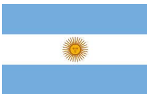
Drapeau de l'Argentine

Même économiquement, il sait prendre ses distances avec le corpus idéologique de la droite américaine. Il s'est ainsi fait remarquer en 2009 dans des éditoriaux publiés dans le "Wall Street Journal" dans lesquels il défendait une plus grande régulation des marchés financiers. Paul Singer y accuse ses amis de Wall Street d'avoir fait trop d'erreurs de jugement qui, en l'absence de tout contrôle étatique, ont déclenché la crise des subprimes.