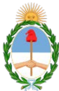
Blason de l'Argentine