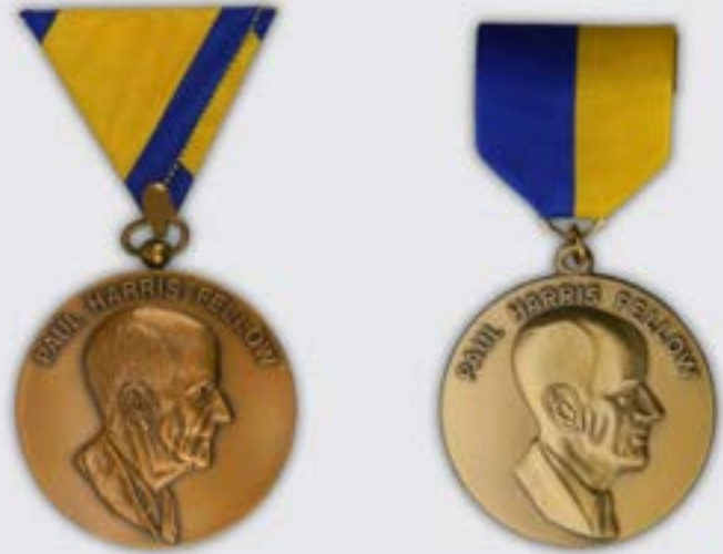
La première médaille PHF (à gauche) et une version plus récente. Différents insignes de boutonnière et rubans ont été également utilisés au fil des ans pour cette distinction.

Toute personne effectuant un don d'au moins 1 000 dollars à la Fondation Rotary ou au nom de laquelle cette somme est versée, devient Paul Harris Fellow.