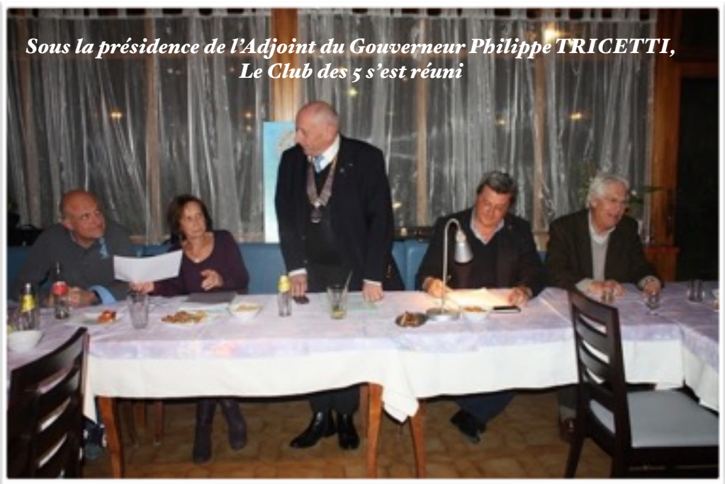
Sous la présidence de l'Adjoint du Gouverneur Philippe TRICETTI, Le Club des 5 s'est réuni

pour tous renseignements complémentaires n'oubliez pas de visiter le site du club http://www.rotary-beausoleil.org ainsi que la page Face Book https://fr-fr.facebook.com/pages/Rotary-Club-de-Beausoleil/566958363356844?sk=info