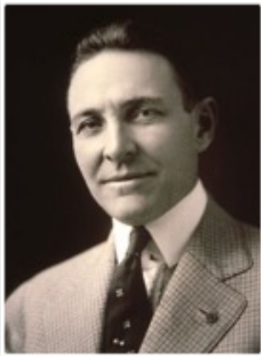
Arch KLUMPH 1er Président de la fondation Rotary

En 1917, le premier don à la Fondation Rotary s'élevait à 26,50 dollars. À l'heure actuelle, le total des dons cumulés versés à la Fondation dépasse le milliard de dollars.