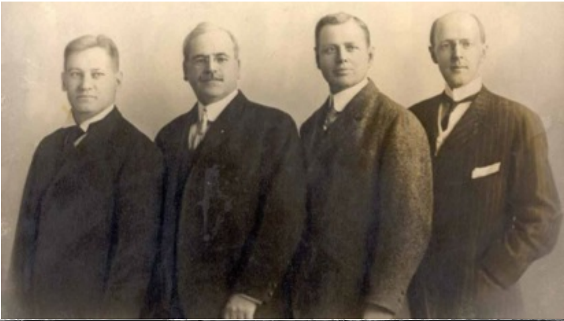
Les quatre premiers Rotariens.