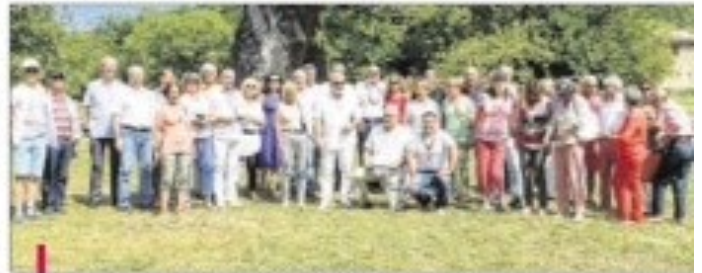
Les membres du club se sont réunis dans la châtaigneraie pour une rencontre champêtre.