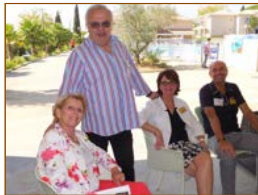
L'équipe organisatrice avec la Gouverneur élue Monique Chomel Besseux

A l'issue des votes le résultat à été donné et l'équipe gagnante verra son affiche réalisée et diffusée à tous les RC du district.